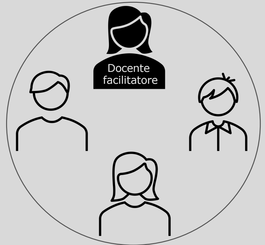
Unità di mentoring